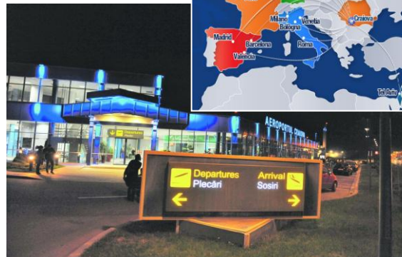
Aeroportul Internațional Craiova