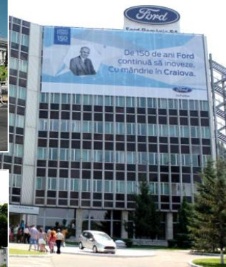
Fabrica de Automobile Ford